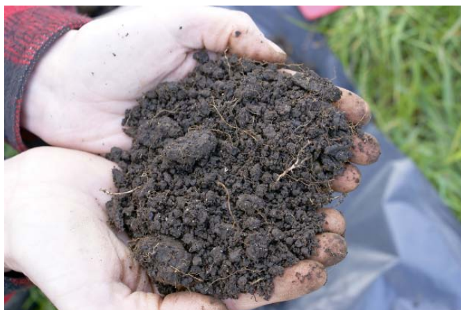
FOTO 2: OP EEN GOEDE VEENBODEM VALT EEN AANZIENLIJK DEEL VAN DE GROND UITEEN IN KLEINE AFGERONDE KRUIMELS.

ken tussen verschillende beheersvormen: landbouw versus natuur, verschillend peilbeheer en verschillen in hoeveelheid en aard van de bemesting.