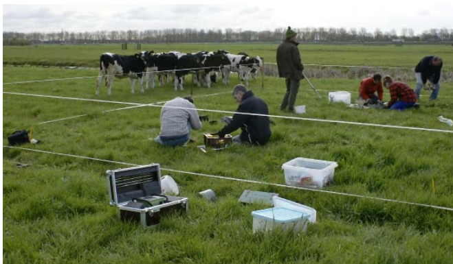
FOTO 1: MULTIDISCIPLINAIRE BEMONSTERING VAN EEN VEENWEIDEPERCEEL LEVERT SOMS VEEL BEKIJKS OP.

Sinds eeuwen zijn de veengebieden van groot belang voor de samenleving van West-Nederland. Al in de vroege Middeleeuwen startte het ontginnen en ontwateren van het veen voor de landbouw en later ook het delven van veen als brandstof. Betere bemalingstechnieken en ruilverkavelingen hebben geleid tot optimalisering van de veenweidegebieden voor de productie van gras en melk. De veenwinning leidde tot polders met lager maaiveld. Een andere oorzaak is de bemaling. Door de grond droog te leggen klonk het veen in en een deel mineraliseerde. Het maaiveld daalde verder, en kwam weer dichtter op het slotwaterpeil te liggen. Vroeger of later volgde een nieuwe peilverlaging. De snelheid van dit proces van veenwinning, inklinking en peilverlaging verschilde van plek tot plek. Zo is een lappendeken van polders en poldertjes met verschillende maaiveldhoogtes en waterpeilen